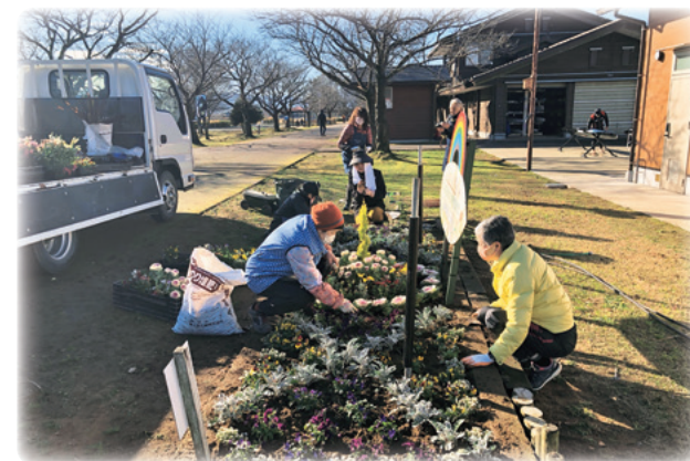
木場潟フローラの会（木場潟公園）