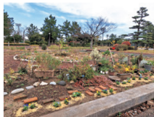
花壇やプランターの設置など