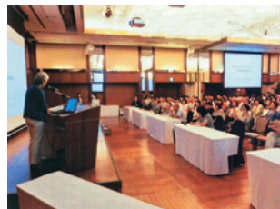
緑化に関する講習・研修・イベントなど